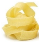
Pappardelle (zzgl. € 2,00)