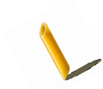
Penne Glutenfrei (zzgl. € 2,00)