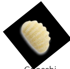
Gnocchi (zzgl. € 2,00)