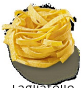
Fagiolatte (zzgl. € 2,00)