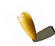
Canneloni (zzgl. € 1,00)